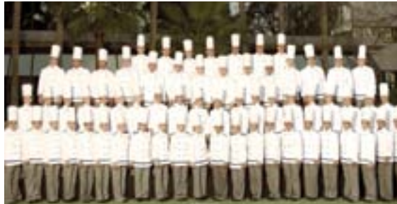
Foto: V Generación de graduados del Campus Monterrey.

Los nueve semestres, 1450 recetas elaboradas, 130 vinos catados, eventos, prácticas e intercambios internacionales, son solo un resumen de lo que 176 Licenciados en Gastronomía, Chef vivieron durante su formación académica en el ICUM donde se gradúan en su XIV y V Generación.