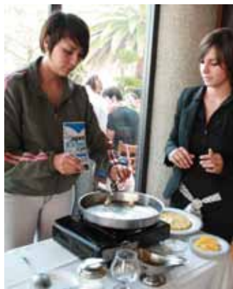
CLASE MUESTRA DE DEPENDIENTE DE COMEDOR

Fueron ocho talleres diferentes (Cocina Experimental, Cocina Internacional, Chocolatería, Repostería, Mukimono, Coctelería, Dependiente de Comedor y Enología) en los cuales alumnos de diversas preparatorias de Hidalgo, Estado de México, Distrito Federal, Tlaxcala, Querétaro y Puebla, tuvieron