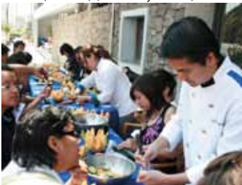
CLASE MUESTRA DE MUKIMONO

Asimismo, durante el evento los jóvenes tuvieron la oportunidad de disfrutar una exhibición de escultura en hielo realizada por un alumno de nuestra institución quien realizó diversos cortes mostrando las maravillas que se pueden lograr a través de una motosierra y un toque de creatividad.